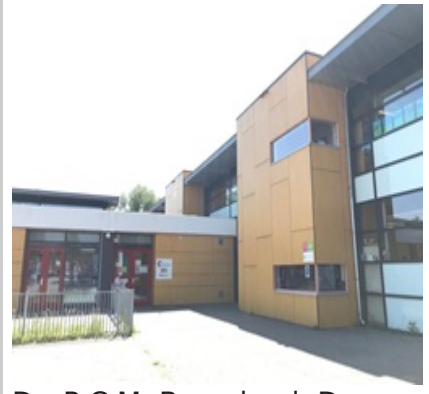
Dr. P.C.M. Bosschool, De Keerkring 70 te Apeldoorn

De Bosschool biedt een leeromgeving waar iedereen welkom is, zich veilig en gesteund voelt en samenwerkt. Eenieder mag zichzelf zijn passend binnen de schoolregels met zijn eigen identiteit en communicatiebehoeften.