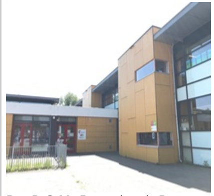
Dr. P.C.M. Bosschool, De Keerkring 70 te Apeldoorn

De Bosschool biedt een leeromgeving waar iedereen welkom is, zich veilig en gesteund voelt en samenwerkt. Eenieder mag zichzelf zijn passend binnen de schoolregels met zijn eigen identiteit en communicatiebehoeften.