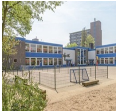
Dr. P.C.M. Bosschool, Bethaniënstraat 5 te Arnhem