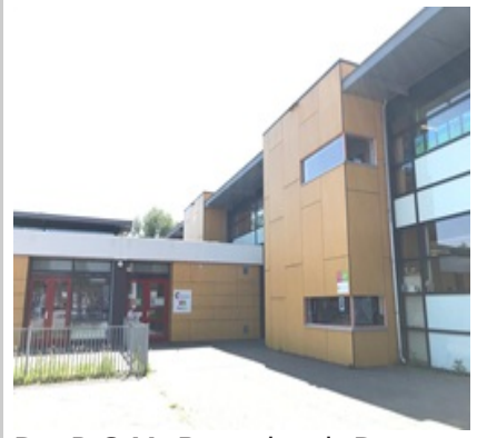
Dr. P.C.M. Bosschool, De Keerkring 70 te Apeldoorn

De Bosschool biedt een leeromgeving waar iedereen welkom is, zich veilig en gesteund voelt en samenwerkt. Eenieder mag zichzelf zijn passend binnen de schoolregels met zijn eigen identiteit en communicatiebehoeften.