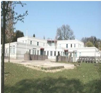
Dr. P.C.M. Bosschool, Hommelseweg 403A te Arnhem

Ook zetten we een aantal praktische zaken op een rij. Van de lestijden en vakanties tot de taken van de medezeggenschapsraad.