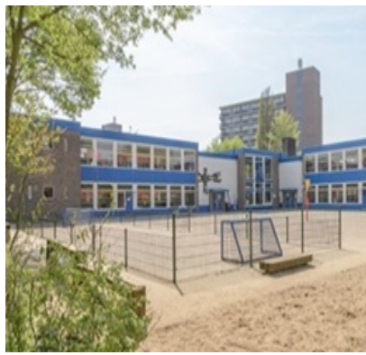
Dr. P.C.M. Bosschool, Bethaniënstraat 5 te Arnhem