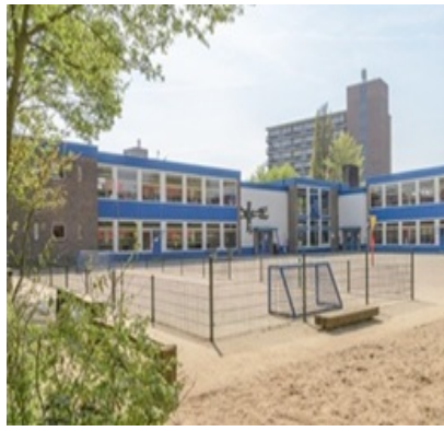
Dr. P.C.M. Bosschool, Bethaniënstraat 5 te Arnhem